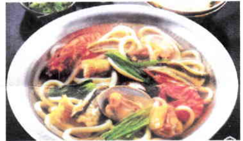
写真は盛り付け例です